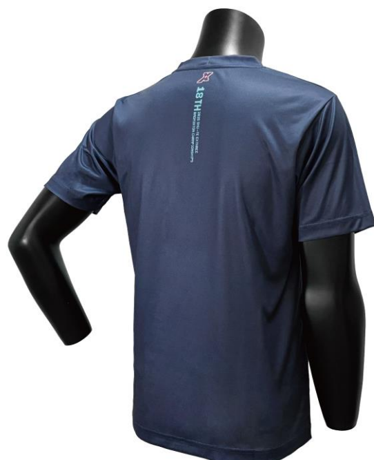
熱昇華 T-Shirt 尺寸表