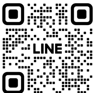
官方 LINE QRcode

FB 網址： https://www.facebook.com/STUOPEN ；官方 LINE：樹德科技大學體育室(ID：@950sksvt； https://lin.ee/jxchfcZ )；IG (網址： https://www.instagram.com/aaker.pe/ )